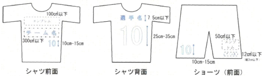
図1 <チーム識別標章(チーム名/エンブレム)及び選手番号のサイズ> (本規程 第5条(1)及び(2))